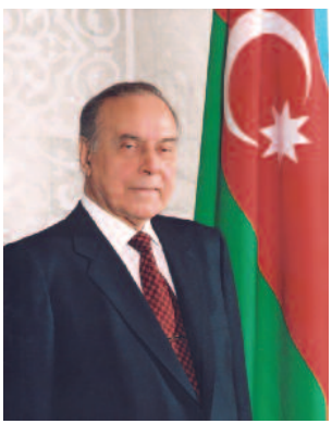
Doğma, canım-varlığım qədər sevdiyim Azərbaycanım mənim qibləğahumdur