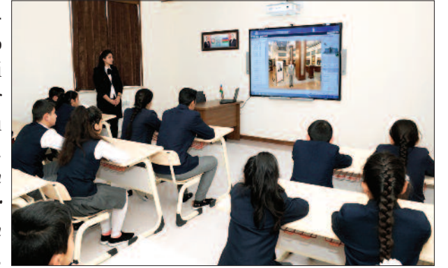
Culfa rayonu, Qazançı kənd tam orta məktəbi

cəhətdən etibarlı dayaq üzərində qurulmuş müstəqil Azərbaycan dövlətini miras qoyub. Ulu öndər Heydər Əliyev xalqımız qarşısında misilsiz xidmətləri ilə bu gün hər birimizin qəlbində yaşayır.