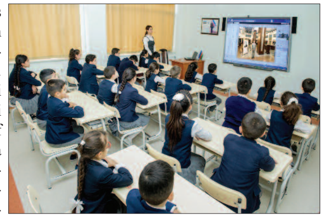
Naxçıvan şəhər 7 nömrəli tam orta məktəb

baycanda əldə edilmiş milli birlik xalqımızın ən qiymətli mənəvi-ideoloji sərvətinə çevrilib. Bugünkü güclü, qüdrətli Azərbaycanı O, öz əlləri ilə qurub-yaradıb, inkişaf etdirib, bütün dünyaya tanıdıb. Ulu öndər ölkəmizin siyasi, sosial-iqtisadi inkişaf konsepsiyalarını işləyib hazırlayıb və reallaşdırılmasını təmin edib. Ona görə də xalqımız ümummilli lideri ilə fəxr edir, qürur duyur, Onun ideyalarını həyata keçirməyə çalışır. "Mənim həyat əməlim bütün varlığım qədər sevdiyim Azərbaycan xalqına, dövlətçiliyimizə, ölkəmizin iqtisadi-siyasi, mənəvi inkişafına xidmət olub" , – deyən ulu öndər Heydər Əliyevin dövlətçiliyimizin ən ağır günlərində göstərdiyi qətiyyət bu sözlərdəki gerçəkliyi dəfələrlə təsdiqləyib. Müdrik rəhbər xalqımıza zəngin maddi və mənəvi dəyərlər, siyasi-iqtisadi